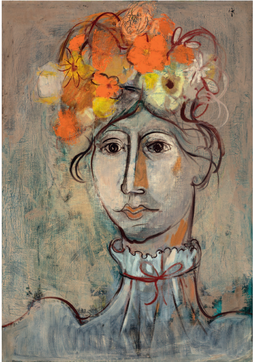
Serie de los Retratos acrílico sobre tela 70 x 50 cm ca 1955/60 E230