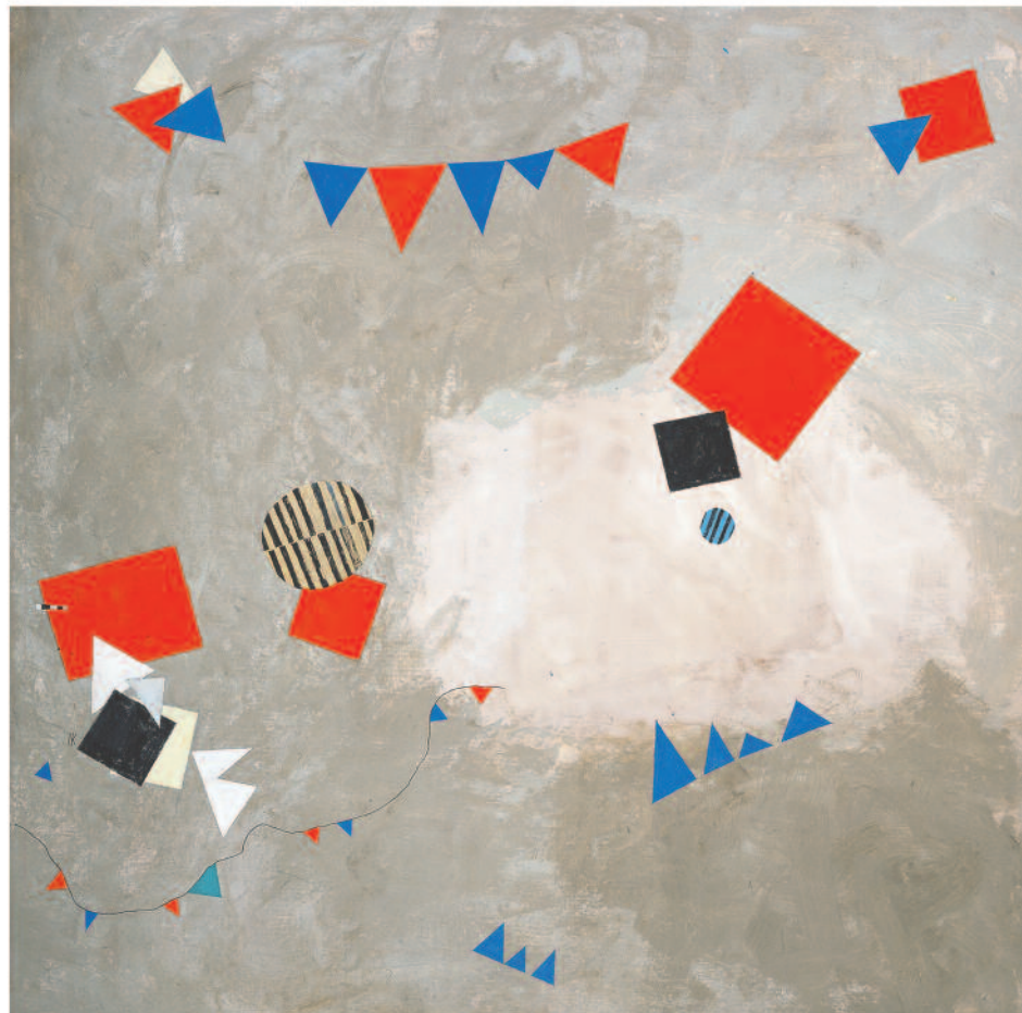
Mural I II III acrílico sobre tela 157 x 157 / 157 x 208 x 157 / 157 x 157 cm 2005 R006 I II III