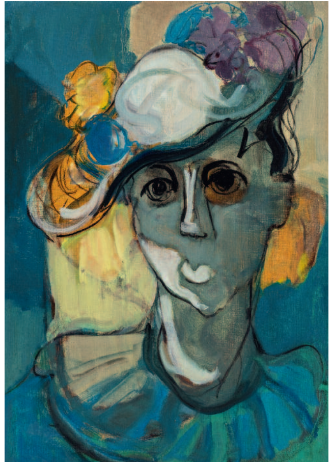
Serie de los retratos acrílico sobre cartón 70 x 50 cm ca 1955/60 E223