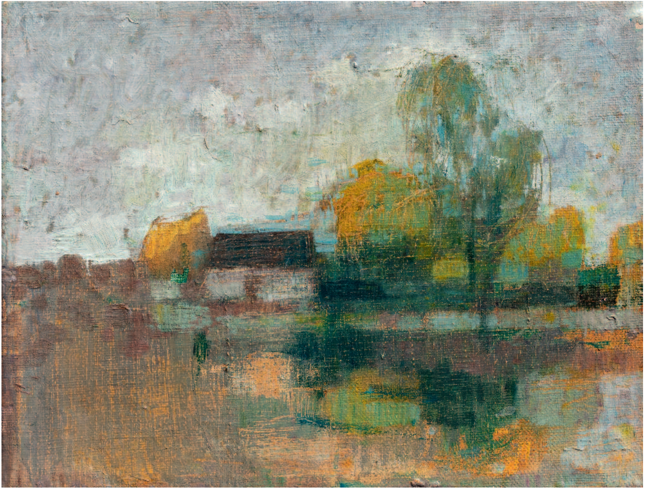
Paisaje óleo sobre tela 18x24 cm ca 1932 CH399