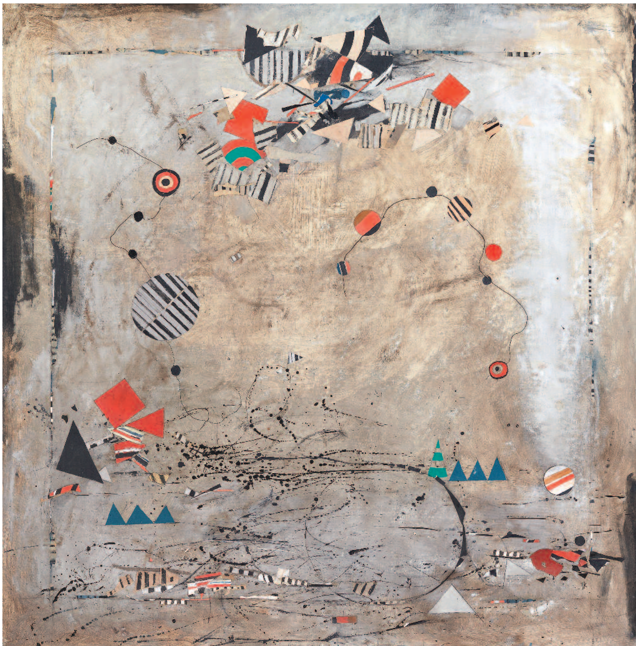
Sin Título acrílico con recortes de papel sobre tela 145 x 145,5 cm ca 2000 R062