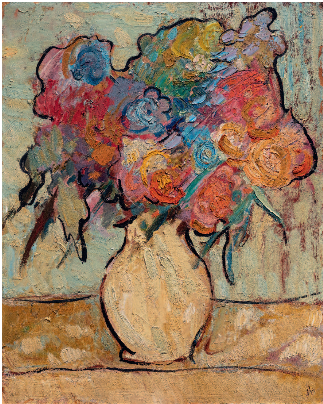
Serie de las Flores óleo sobre cartón ca 1955/60 F027