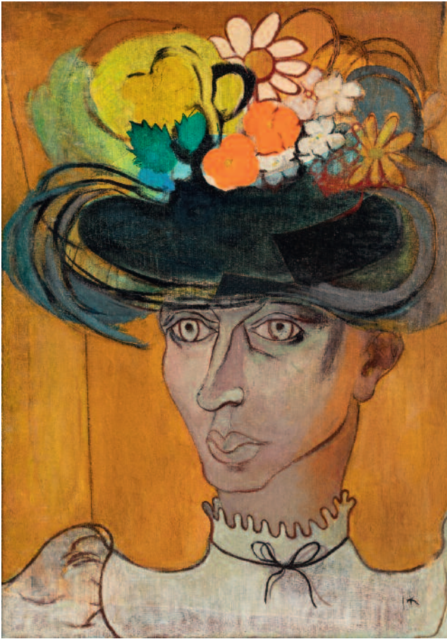
Serie de los retratos acrílico sobre tela 50 x 70 cm ca 1960 colección privada E225