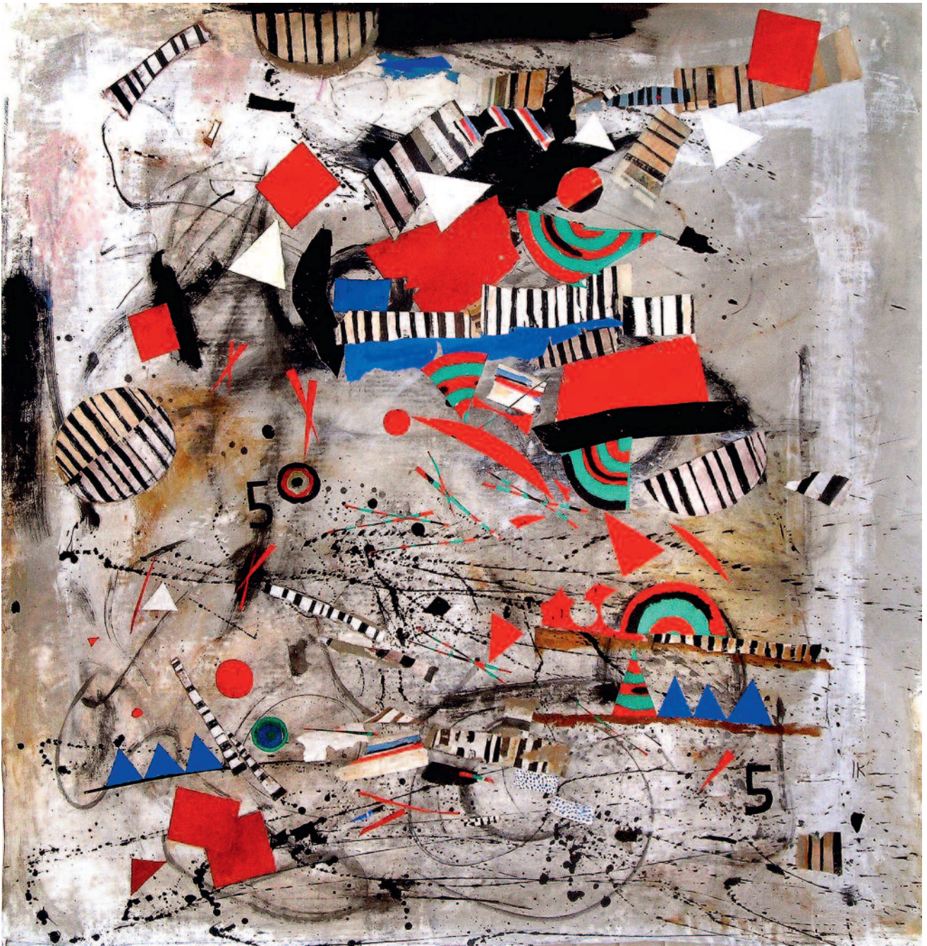
Serie de Arabescos. acrílico con recortes de papel pintado sobre tela 124 x126 cm 2004 R003 Colección privada