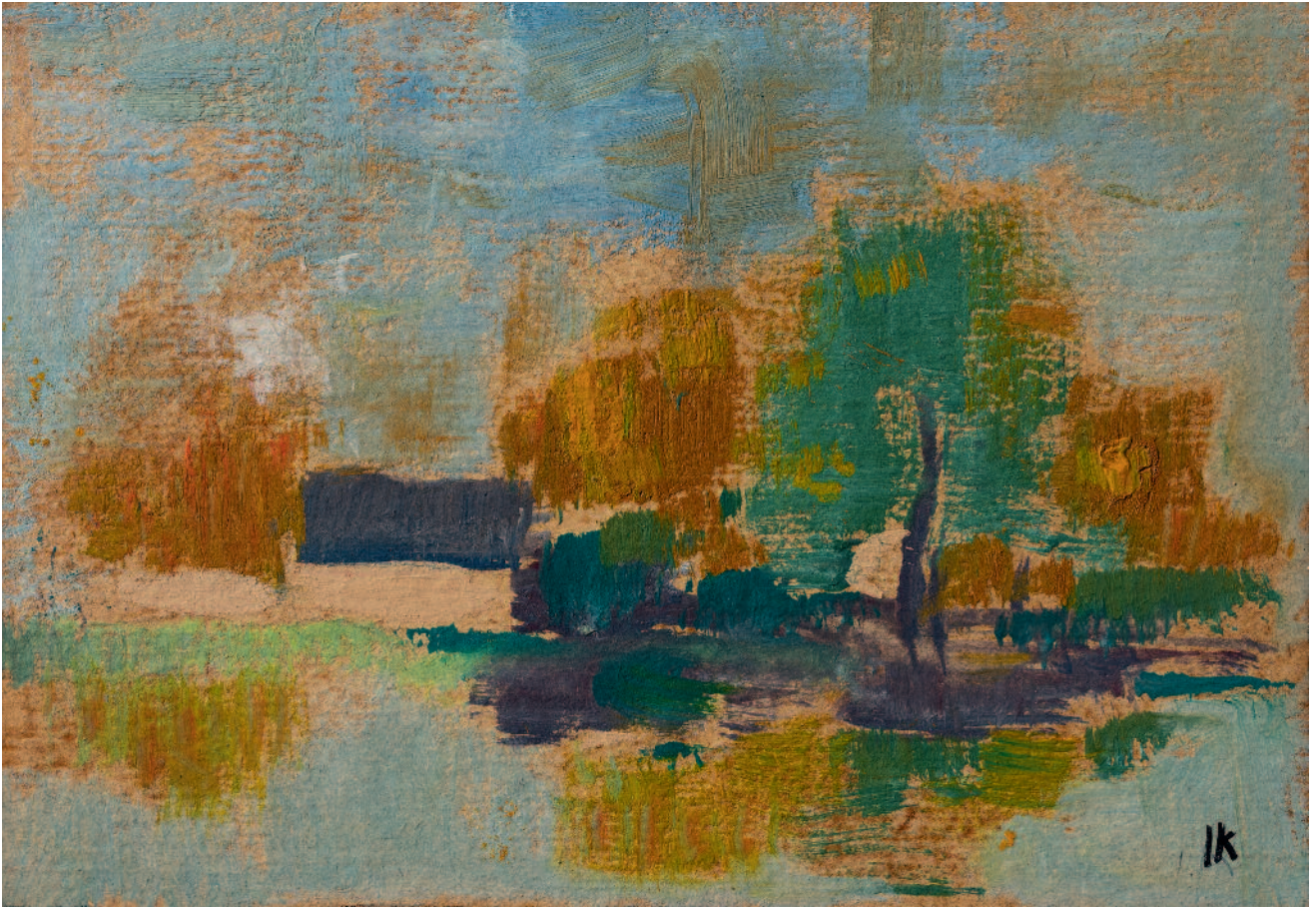
Paisaje óleo sobre carton 14,5 x 21cm ca 1932 CH400