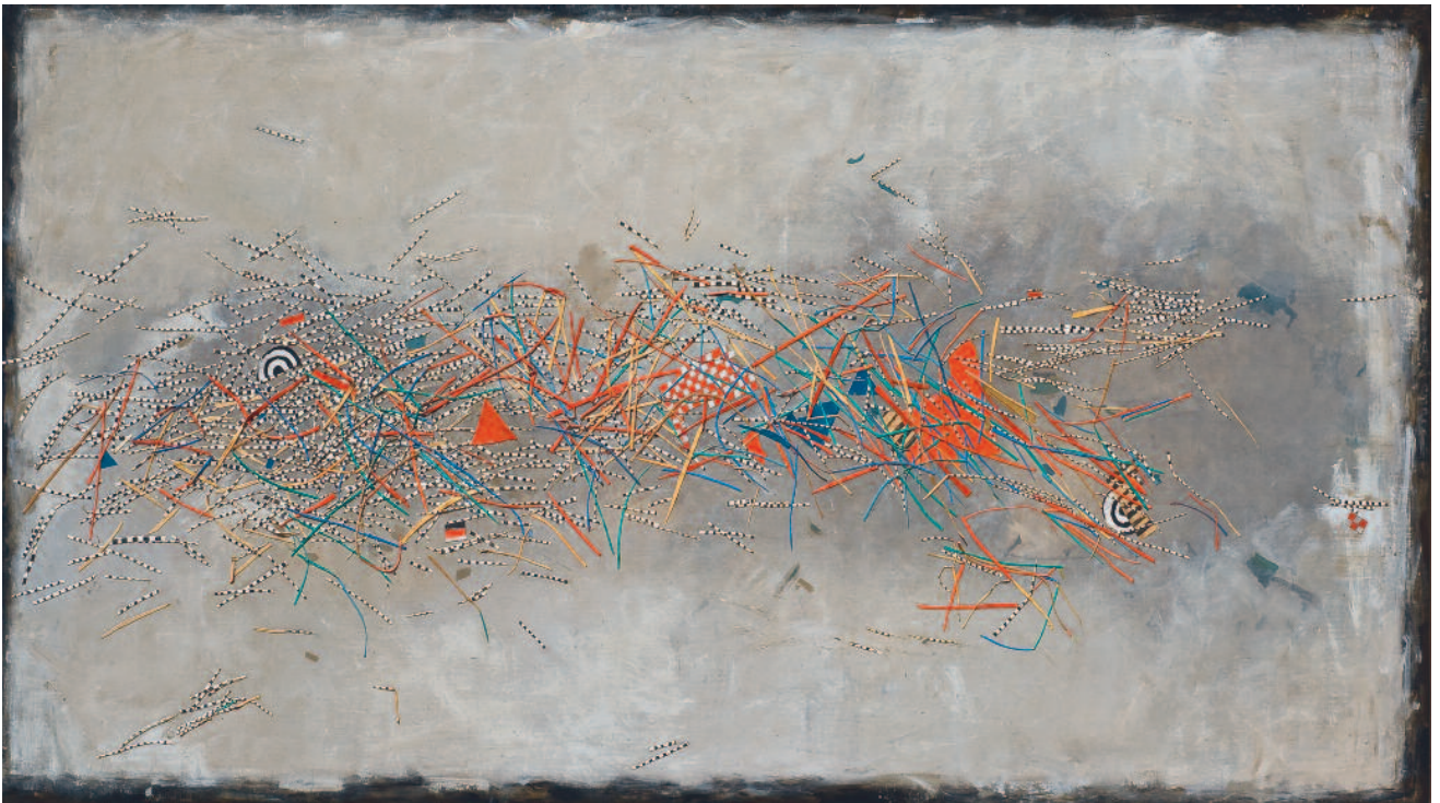
Serie del Tigre acrílico con recortes de tela pintada sobre tela 103 x 205 cm 2011 R047 colección privada