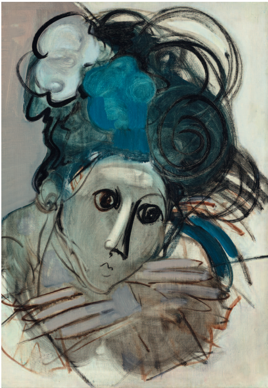
Serie de los Retratos acrílico sobre tela 70 x 50 cm ca 1955/60 E233