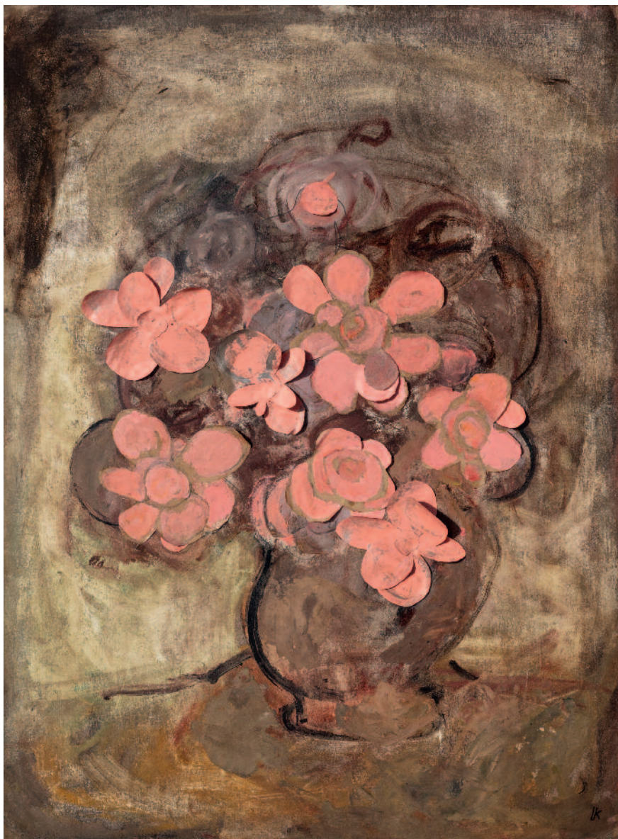
Pág. anterior Serie de las flores óleo sobre cartón 39,3x49,7 cm ca 1955/60 F026