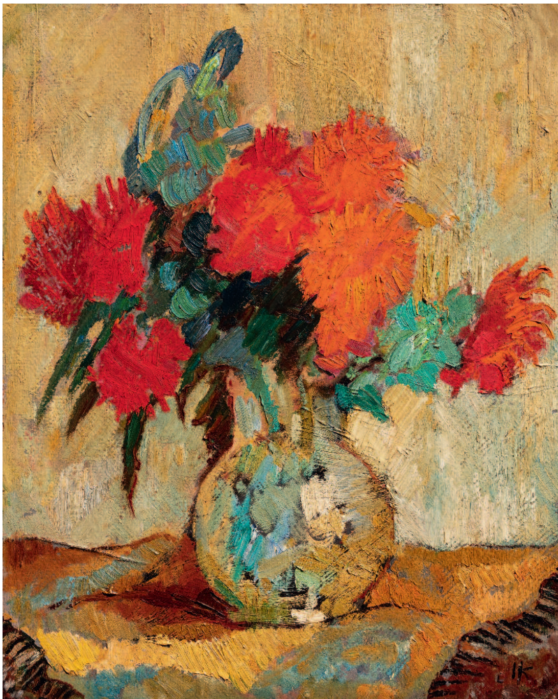
Serie de las Flores óleo sobre cartón 39,3x49,7 cm ca 1955/60 F025