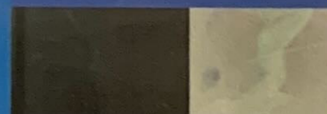
Pablo Guarderas (Ecuador) + 8 - 17 (Video)

Sus piezas analizan los límites de la confianza. Ella explora la vulnerabilidad desde los parámetros de la entrega incondicional.