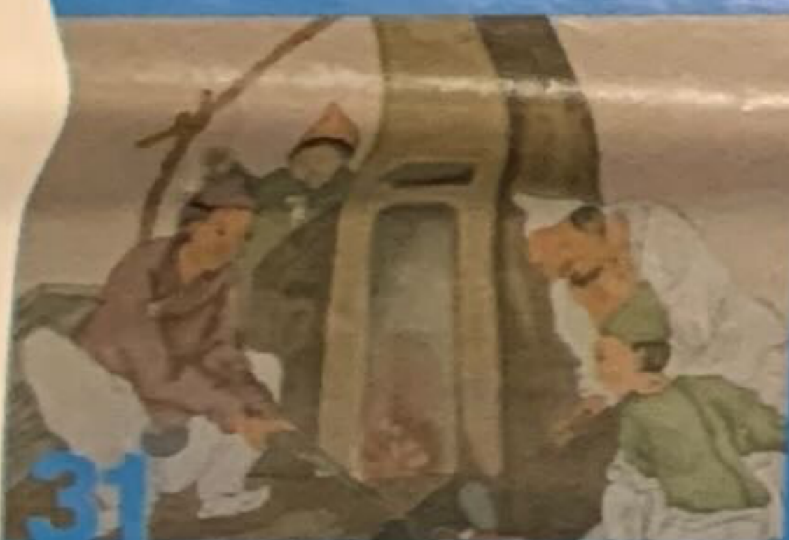
Exposición de los Talleristas de Arte Coreano

Evoca historias en sus fragmentos de momentos pasajeros. Con un enfoque claro ella abstrae la esencia de sus experiencias.